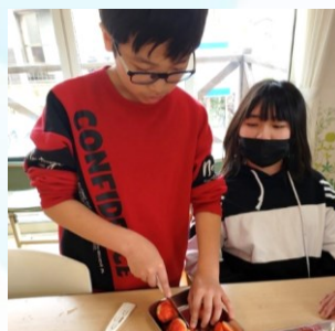
👉プリンアラモード作り 「イチゴ、どう切ろうかな…」