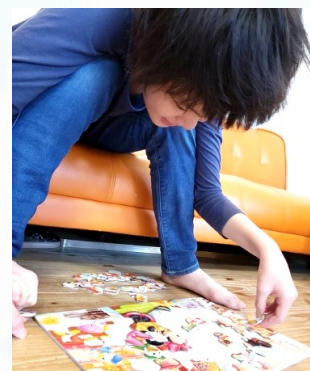
「得意のパズル がんばるぞー」