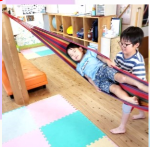
👉ハンモック 「1. 2. 3~10で交代ね」