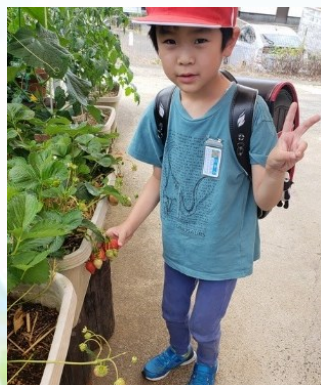
「(イチゴ) 食べたいなあ〜」

子どもたちが見せてくれる、小さな発見や気づきを大切に、それぞれが安心して過ごせるよう、スタッフ一同、寄り添いながら、見守っています。