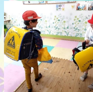
👉ピカピカの1年生 元気に「ただいまー」