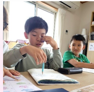
👉宿題の時間 「ムズカシイ!」