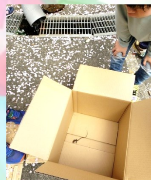
カナヘビ発見 ・捕獲!!