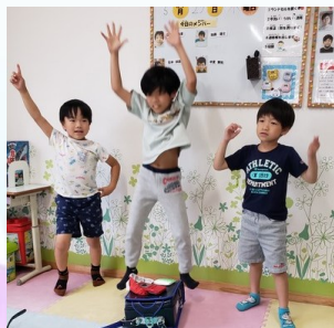
👉元気いっぱい ダンス★